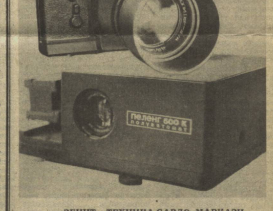
«ЗЕНИТ» ТЕХНИКА-САВДО МАРКАЗИ «СОУЗРЕКЛАМА» БУТУНИТТИФОҚ ИШЛАБ ЧИҚАРИШ БИРЛАШМАСИНИНГ ЎЗБЕКИСТОН РЕКЛАМА ИШЛАБ ЧИҚАРИШ КОРХОНАСИ.

Адрес: Ленин району, Т. Шевченко кўчаси, 30 уй. Иш соатлари: соат 10 дан 19 гача. Танфуқ — соат 14 дан 15 гача. Дам олиш куни — душанба.