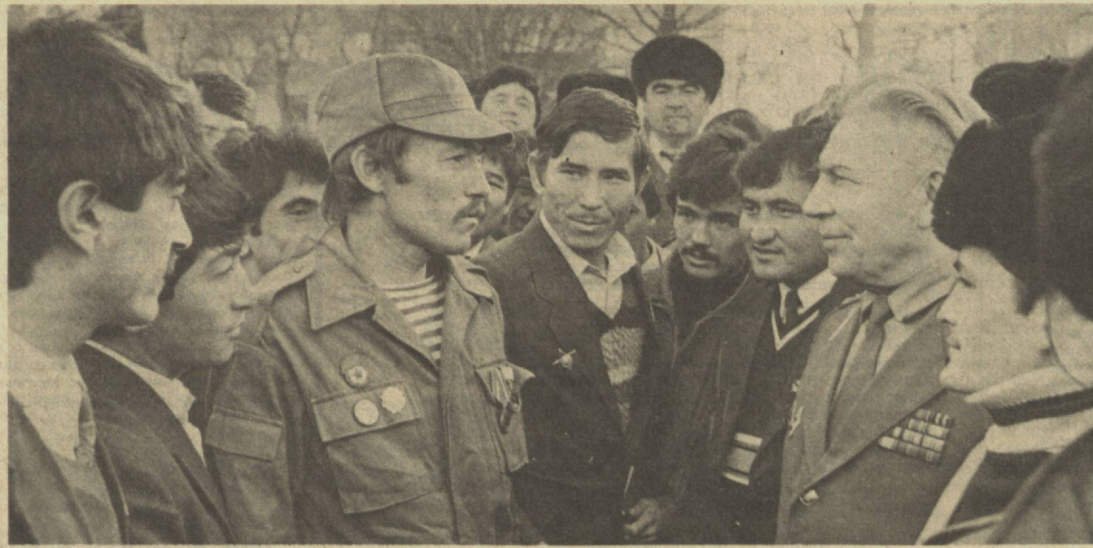
Интернационал жангчиларнинг ўзинга ҳос аниқлиги қатнашчилари турли давраларда қизгин мунозаралар олиб боради. СУРАТДА: интернационал жангчилар учрашувида.

ҳаммага аён. Уларга муштаҳкам база керак. Парашют ажитациясини илтимос қилишди. Албатта бу борда кўрсатма бериш қийин. Лозим даражада ҳарбий техника берилган тақдирда ҳам уни сақлаш, ремонт қилиш, ёқилги билан таъминлаш каби муаммолар кўндаланг бўлади. Спорт базаси масаласида эса жойларда руҳсат этилган ҳарбий қисмлар машқ майдонидан фойдаланиш мақсада мувофиқ деб ўйлаймиз.