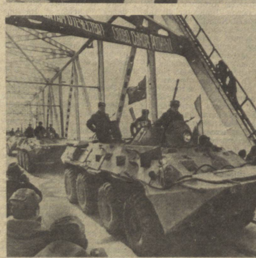
Суратларда: 1. Чекланган совет қўшинлари қисмининг қўмондони генерал-лейтенант Б. В. Громовни ўғли кутиб олаётди. 2. Афғонистондан қайтаётган сўнги совет жангчилари.