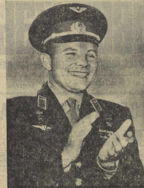
ТОШКЕНТЛИК УПСОЗЛАР ТАШАББУСИГА ҚУШИЛИБ

В. И. Ленин яқин, революцион ҳуқуқ ўзида давлат тасалида турган синфнинг проласини ифода этишини таъкиқлади, ҳоқимият сиёсий қатгориалдир ва шунингдек