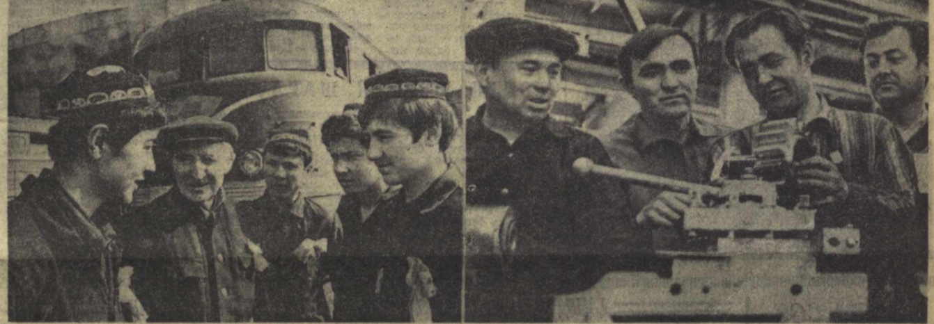
Ушдангиди шулар ва бошқалари. Улар шайбалонда юнори меҳнат уюмдорлигига эришилар.

Жиззах: СИФАТ БЕЛГИСИ БИЛАН. Усти тринкотаж фабрикаси — қўриқ объектдаги энг беш санат корхоналаридан биринчи. Унинг беш йиллик тегишсиз бўлган коллективидан 1212 киши коммунистик шайбалонга чиқди.