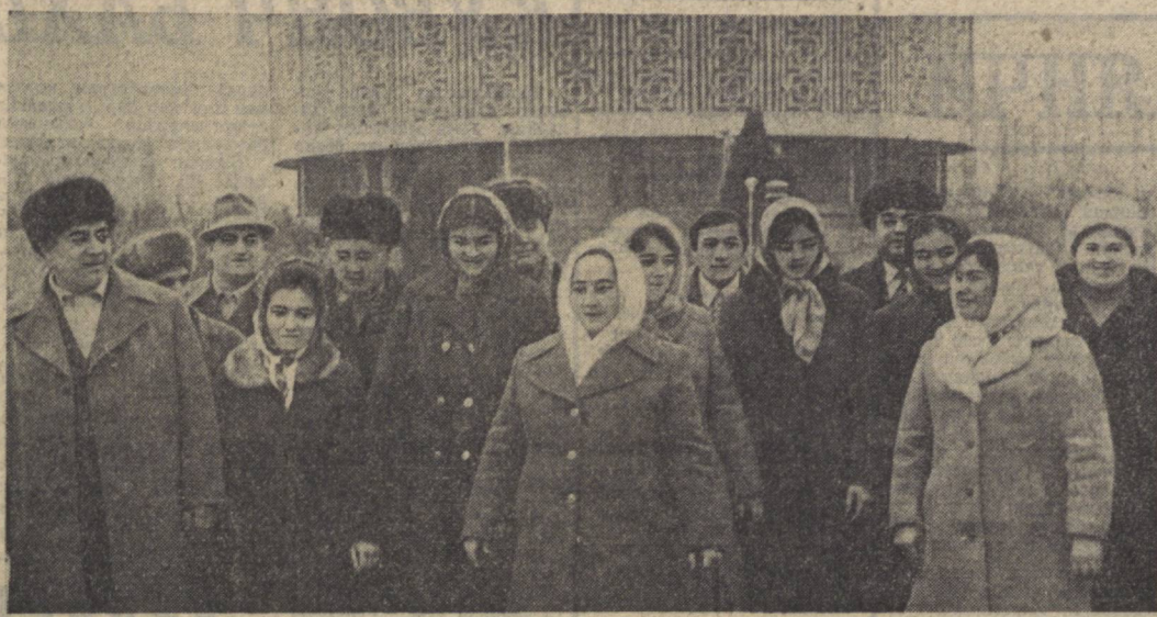
Суратда: Ўзбекистон касабасоюзлари XII съезди делегатларидан бир гуруппаси.

Ўзбекистон касабасоюзларининг XII съезди меҳнаткашларнинг ижодий куч-ғайратини ўн бичинчи беш йилликда республика экономикасини янада жадал суръатлар билан ривожлантириш, социал тараққиётнинг катта-катта проблемаларини ҳал этишга ослантирди. Ҳеч шубҳа йўқки, улар ўзларига берилган ҳуқуқлардан тобора кенг фойдалана бориб, меҳнаткашларнинг таърих-ташаббусини КПСС XXVI съезди ва Ўзбекистон Компартиясининг XX съезди қарорларини тўла амалга ошириш учун курашга сафарбар этидилар, бошқариш, тўғрилик, илмий юртиш, коммунизм мактаби бўлишдан иборат ленинча қондага оғишмай амал қилвердилар.