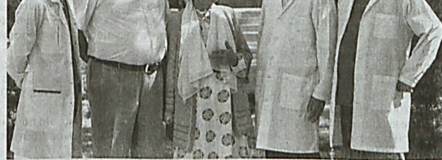
Сурхандарьинская область.

В ходе состоявшегося 11-12 февраля 2017 года визита в Сурхандарьинскую область Президент нашей страны дал соответствующие указания по повышению качества и эффективности медицинских услуг, реконструкции и оснащению на уровне мировых стандартов действующих и строительству новых учреждений. В рамках их исполнения изучили вопросы, связанные с глазами и заболеваниями, и наметили необходимые меры по организации в Термезе филиала Республиканского специализированного научно-практического медицинского центра микрохирургии глаза. Провели реконструкцию бывшего здания областного перинатального центра, открыли филиал на 75 мест, рассчитанную на 150 посещений поликлинику. На строительные-ремонтные работы затрачено 7,5 миллиарда сумов, на закупку современного оборудования - более трех миллиардов сумов. Согласно статистике, в год в среднем более трех тысяч человек из Сурхандарьинской области обращались в Республиканский специ-