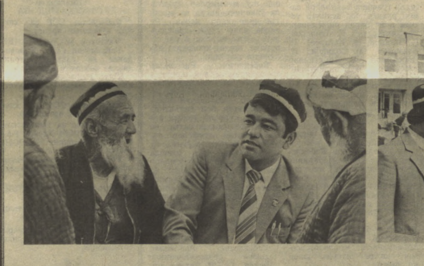
ЭЛ ХИЗМАТИДА 576-Избоскан территориал районидаги «Маданият» соҳасидаги маълумотлар билан боғлиқ воқеа ва ҳодисаларнинг ўзига хос сабаблари бор. Аввало, маҳаллий партия ва совет органлари фаолиятида юқорида таъкидлангандай, омма атеистик руҳда тарбияланган бораётиб юзакчилик устуни келган бўлса, иккин-

«ЕШ ФИЗИК» Ўзбек совет энциклопедияси бош редакцияси «Еш физик» энциклопедияси тўғрисидаги китобларга таъкид этиди. «Педдагогика» (№, 1984) нашриётида чиқарилган шу номдаги китоб эсоса таъйёрланган маълум маҳаллий материаллар билан бойинган. Ундан физика фани соҳасига доир қўндалма саволларга жавоб топш мумкин. Маълумнинг асосий вазифаси ўқувчиларга касб таълимда ёрдам бериш бўлиб, унда ёш физикларга амалий маслаҳатлар ҳам мўлжалланган. Китоб асосан ўрта ва катта ёшдаги мактаб ўқувчилари, ўқитувчилар, физикага қизиқувчиларга мўлжалланган. Болалар ва ёшлар учун турли соҳалар бўйича энциклопедик лугатлар таъйёрлаш бундан бун муҳтаж давон этирилади. Шу йилнинг охирида «Еш физик» маълумоти билан боғлиқ китоблар чиқариш мўлжалланган. 1990—1995 йилларда эсе математика, техниклар, географлар, адабиётчилар учун шундай лугатлар нашр этиш планлаштирилган. Л. ДАВАЛЬЧЕНКО, Ўзбек совет энциклопедияси бош редакцияси масъул секретари.