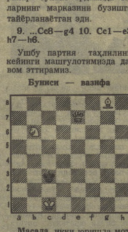
Масала. икки юришда мот.