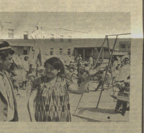
«Совет Ўзбекистони» махсус мухбири. Б. САТТОРОВ, «Совет Ўзбекистони» мухбири.