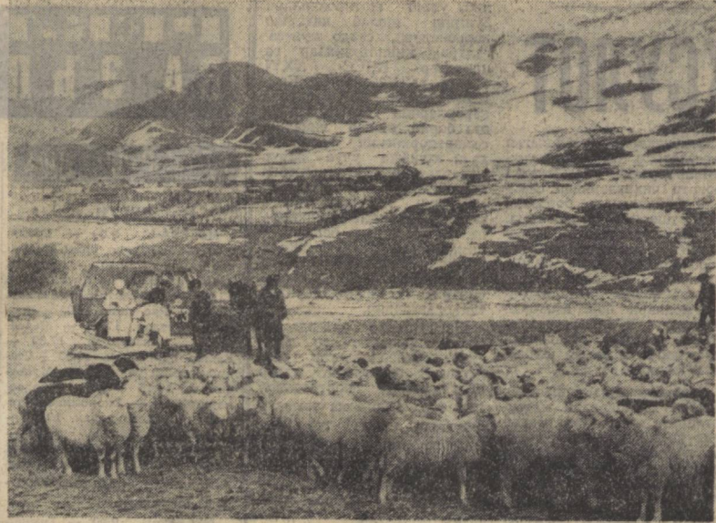
Шу йилларда Бўстонлик район марказий касалхонаси ходимларини тез-тез йилларда учратиб туриш мумкин...