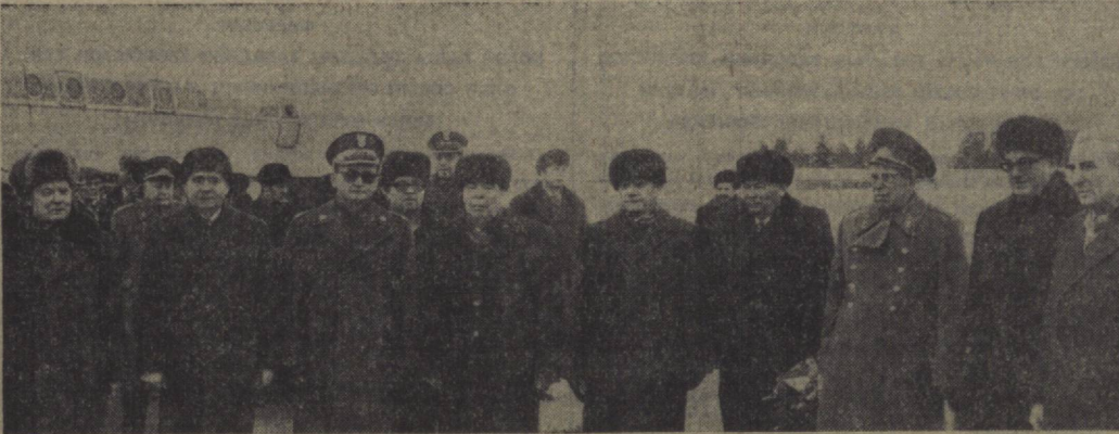
Суретда: аэропортда кутиб олинш пайти.

ТУРКҮЛ (Қоракалпоғистон АССР) 1 март. (ЎЗАТАГ). Туркўл районининг меҳнатчилари 1981 йилда жуда яхши курсаткичларга эришдилар. Улар Ватан оьборларига 48 миң тоннадан эиёд «оқ олтин» етказиб бердилар, бу эса план тошқирига белгиланганидан анча кўдир. Давлатга қишлоқ хўжалик маҳсулотларининг кўпгина бошқа турларини сотиш тошқирлари ошириб бажарилиди. Бутуниттифоқ социалистик мусобақасида юксак натижаларга эришганлиги, 1981 йилги ихкисодий ва социал ривожланиш давлат планини муваффақиятли бажарганилиги учун Туркўл райони КПСС Марказий Комитети, СССР Министрлар Совети, ВЦСПС ва ВЛКСМ Марказий Комитетининг кўчма Қизил Байроғи билан мукофотланди. Райондаги меҳнат коллективлари, жамо-