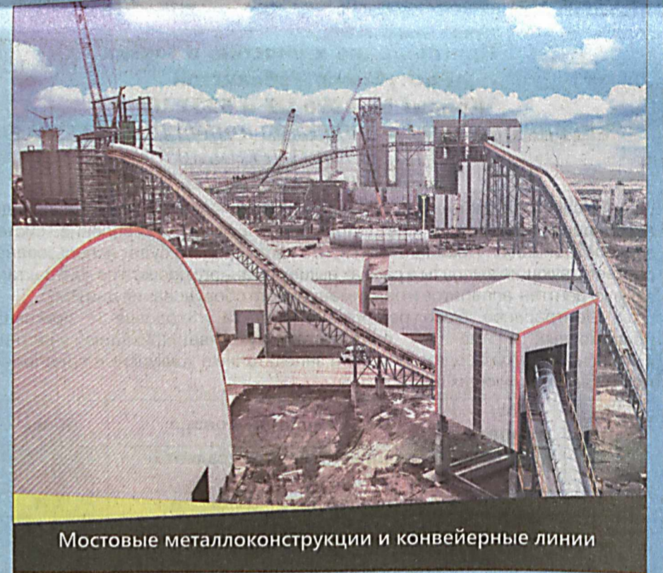
Мостовые металлоконструкции и конвейерные линии