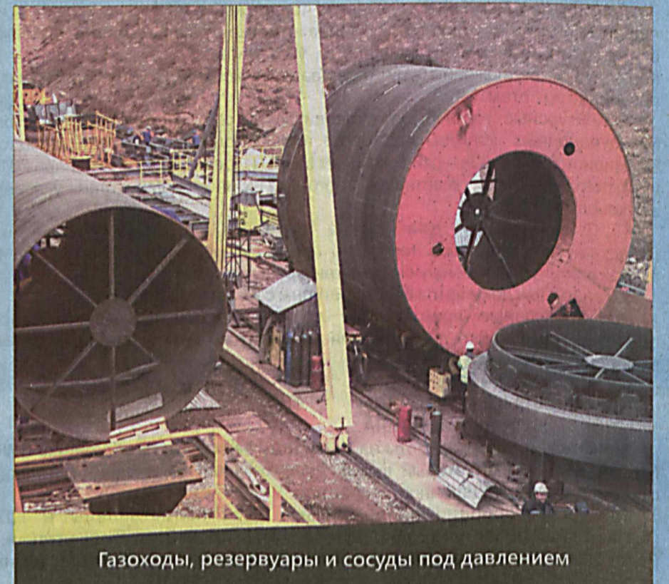
Газоходы, резервуары и сосуды под давлением