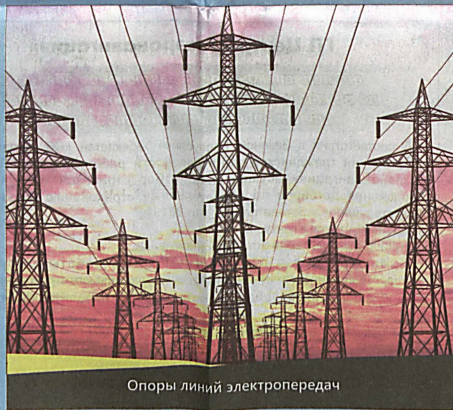
Опоры линий электропередач