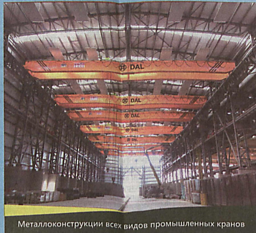
Металлоконструкции всех видов промышленных кранов