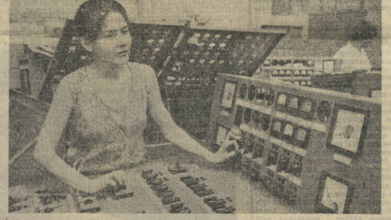
Тошкент саноат корхоналарида КПСС XXVI съезди шарафига муносиб меҳнат сагалари таёрлаш ҳаракати қизгин тус олиб бормоқда. «Средазтеппроаппат» ишлаб чиқариш биросидаги Тошкентдаги бош корхонаси коллектив маълуматлари ва чет эллардаги истеъмолчиларга.

Доҳий Ленин икчилб тонги арафасидаёқ транспортни мамлакат экономикасининг энг муҳим негизларидан бири, деб баҳолаган эди. Дарвоқе, транспорт социализм моддий базасининг ажрамас таркибий қисми бўлиб, у социалистик жамият ишлаб чиқариш кучларини ривожлантиришда етакчи омилидардир. Меҳнат Қизил Байроқ ордени Ўрта Осен пароходчилигининг пешмарда ҳўжалиги — Термиз дарё порти ишчилари, илҳомбахш ходимлари улуғ доҳий василатларга оғишмай амал қилиб, ўзларининг пратувчилик меҳнатлар билан Улуғ Ватанимиз халқ ҳўжалиги тараққийтига муносиб ҳисса қўшиб келаятирлар. Ленинча зарбдор вахтада меҳнат қилаётган, ўзларининг ҳалол ва фидокорона меҳнатлари билан юксак қўқилишни забт этаётган Аму даргаларига муваффақиятлар тилаймиз!