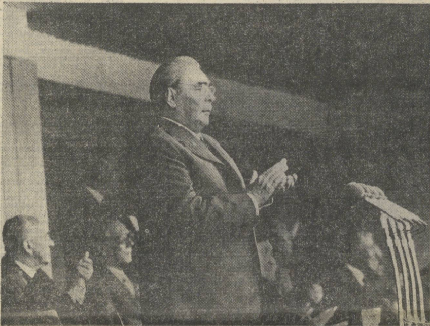
МОСКВА. 1980 йил 19 июль. Леонид Ильич Брежнев XXII Олимпиада ўйинларини очиб деб эълон қилмоқда. Олимпиада машъали ёнildi.

Совет Иттифоқининг давлат гимни ижро этилди.