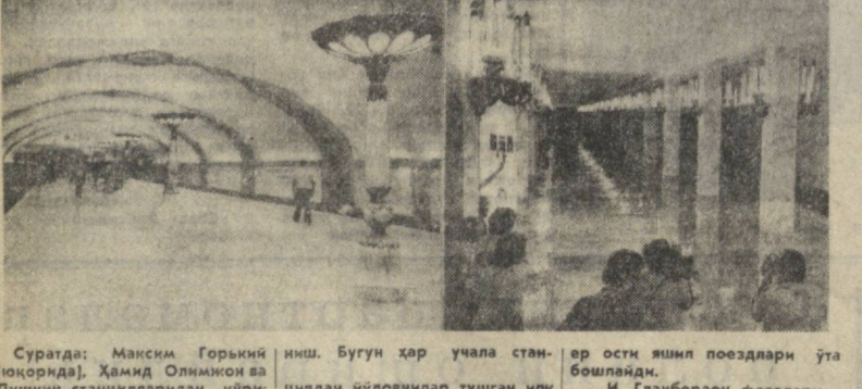
Суратда: Максим Горький (юқоридан), Ҳамид Олимжон ва Пушкин станицаларидан кўри...

«Вашингтон пост» газетаси «Вашингтоннинг янги ядро стратегияси ҳозир янги ўзгаришларга эришди» деб хабар қилди.