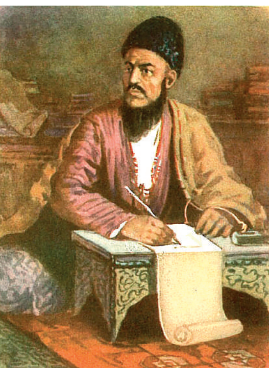
Шоир ўғил етиб келган ҳамони, Кекса отанинг ҳам узилди жони...