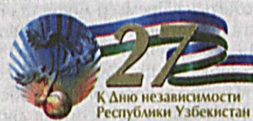
Дни независимости Республики Узбекистан