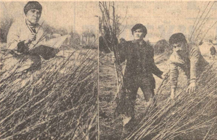
ТОШКЕНТ ОБЛАСТИ. Оржоникидзе районидagi «Тошкент» кўнчили совхозини боғбонлари...

ривга мўлжалланган илмий аппаратлар ўрнатилган. Аппаратлар нормал ишлаб турибди.