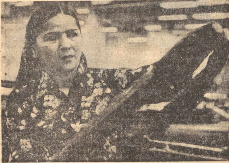
НАМАНГАН ОБЛАСТИ. КПСС XXV съезди номли аври газламалар комбинатида илгорлар сафи тобора кенгайиб бормоқда...

Ишлаб чиқаришни ривожлантиришда изчиллик талабларига риоя қилиш — зафарлар калити.