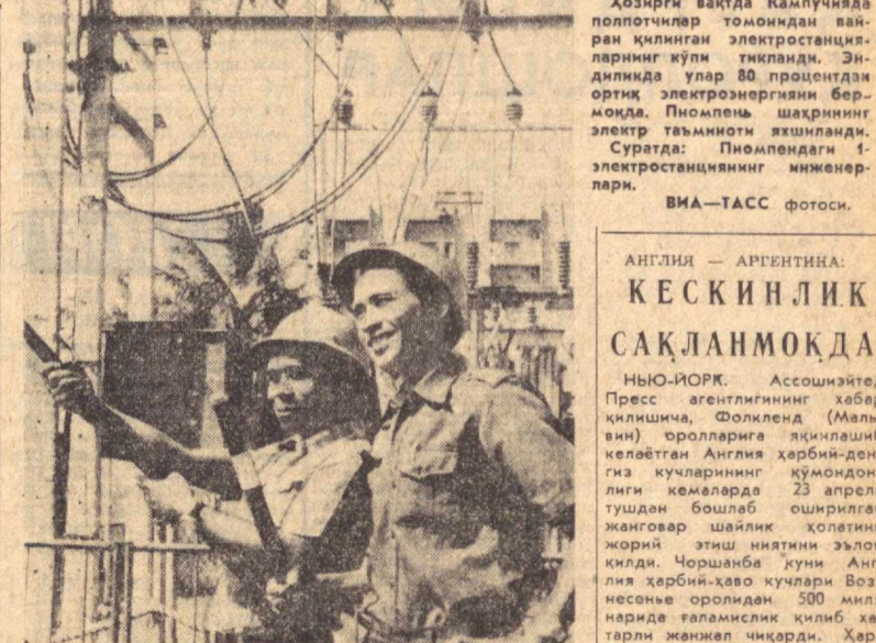
Хозирги вақтда Кампучияда полпотчилар томонидан вайрон қилинган электростанцияларнинг қўли тикланди. Эндилкида улар 80 процентдан ортиқ электрэнергияни бермоқда.

Мехико. Мексика миллий конгрессининг тақлифия биноан КПСС Марказий Комитети Сийсий бюроси аъзолигига кандидат, Озарбайжон Компартияси Марказий Комитетининг биринчи секретари, СССР Олий Совети делегацияси расмий дўстона визит билан бу ерга келди.