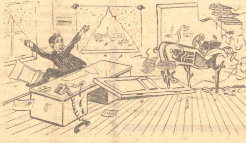
Трактор — Андиша қилсам бу йил ремонтсиз қолдиганга ўқшайман. Қ. МАМАТОВ чизган расм.

Қиш жойларда меҳанизаторлар тайёрлаш турт олин кўрсати очилди. Гуё шу билан иш туғиди. Қишлоқ хўжалиқ органилари, «Усельхозтехника» Автоном респу-