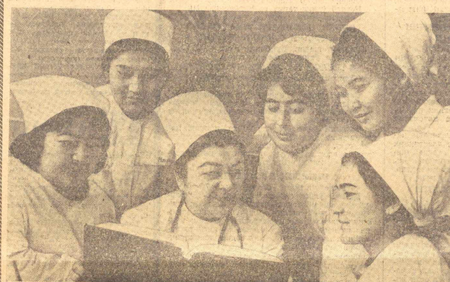
Суратда: профессор С. Йўлдошева илиқина ҳамширалари даврасида.

Д. ДМИТРИЕВ. [ТАСС махсус мухбири]. Олис космик алоқа маркази.