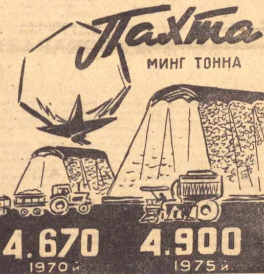
Янги беш йилликда Ўзбекистонда пахта етиштиришнинг ўсиши.

СОЦИАЛИСТИК МАЖБУРИЯТЛАР ПАРРАНДАЧИ- ЛИК ФАБРИКАСИ КОЛЛЕКТИВИНИНГ 1971 ЙИЛ 29 ЯНВАРДАГИ УМУМИЙ ЙИГИЛИШИДА МУҲОКАМА ЭТИЛИБ, ҚАБУЛ ҚИЛИНГАН.