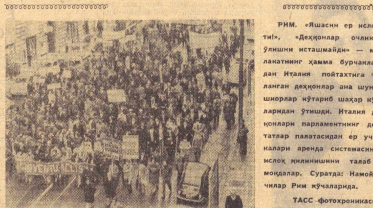
Рим. «Яншилар ер ислоҳоти».

Ишсизларнинг журналистлар билан қилган суҳбатига айтилган бу аламли гаплар Америка газеталарида босилиб чиқди ва бундай гапларни автомобил саноатининг пойтахти Детройтдагина эмас, ҳатто мамлакатнинг бошқа ҳар қандай саноат марказида ҳам эшитиш мумкин.