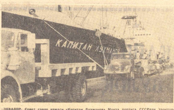
ЭКВАДОР. Совет савдо кемаси «Капитан Лухманов» Манта портига СССРдан тракторлар ва цемент олиб келди. Суратда: Манта портида юк тушириш пайти.

ЯГОНА ДУСТИМ 87 ёшида вафот этган инглиз Алис Уоллис фаннинг 30 минг фунт стерлинг қимматидаги бутун бойлигини Лондондаги Вестминстерлик банкига топширилганини васият қилиб қолдирди.