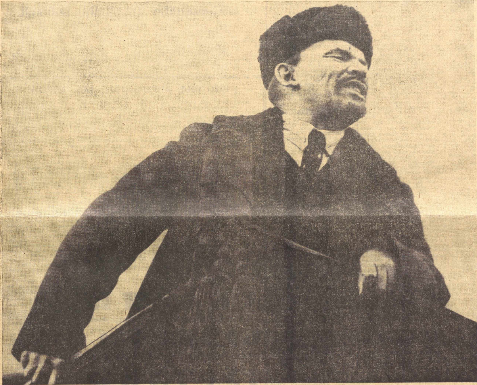
В. И. Ленин «Улуг» Октябрь Социалистик революциясининг бир йиллиғида Қизил-майдонда-нутқ сўзламоқда. Москва, 7-ноябрь, 1918-йил.

Делегатлар билан меҳмонлар яқдил бўлиб ўринларидан турарди. Гулдурок қарсақлар ва «Ура!» деган дўстона саводалар янгради. Залда «КПСС! КПСС! КПСС!», «Абадий дўстлик» деган сўзлар янгради.