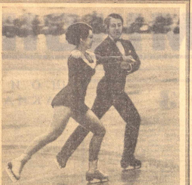
ФИГУРАЛИ УЧИШ УСТАЛАРИ ТОШКЕНТДА