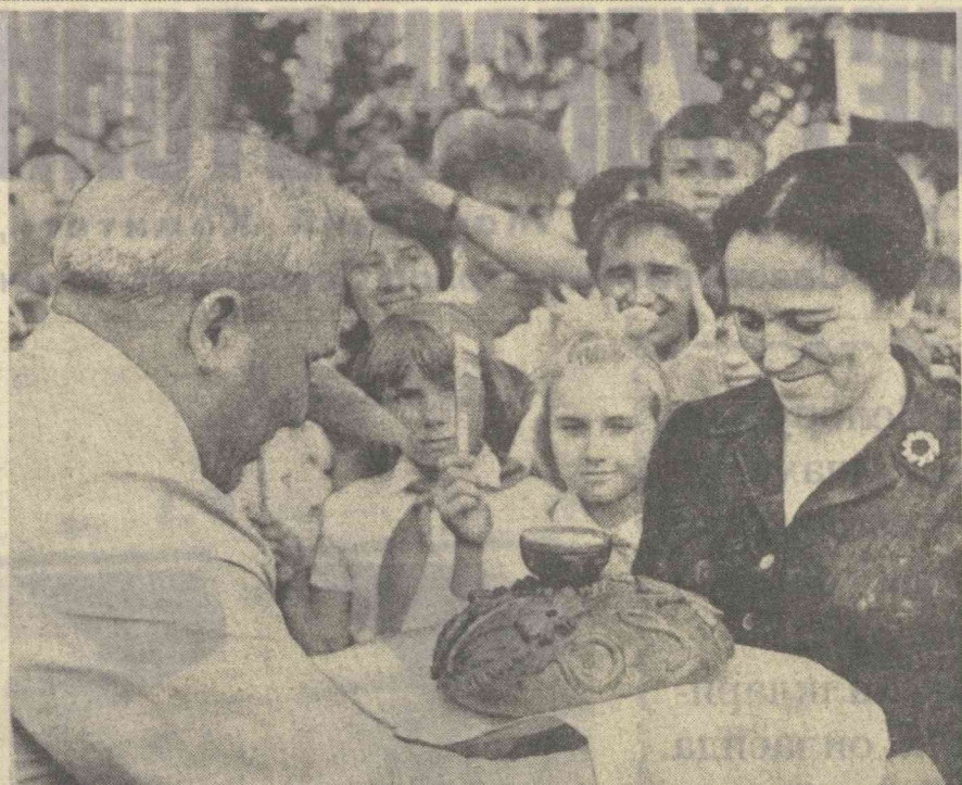
Белоруссияда ўзбек адабиёти ва санъати декадаси кўзгин давом этмоқда. Суратда: декада қатнашчиларининг Полоцк шаҳрида кутуб олинчиши. Ўзбекистон ССР халқ шоираси Зулфия Қардошлиқ раъзи бўлган.

МИНСК, 9 июль. (ЎзТАГ махсус мухбири). Ўзбекистон ёзувчиларининг бир гуруҳиси бугун тушдан кейин Беларуссия халқ шоири Янка Купала туғилб ўсган жойга — Молодечо районидаги Визинка қишлоғига — боринди.