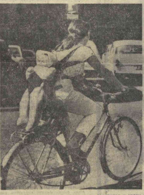
Дания, Скандинавия мамлакатларида велосипед урдан бу ерга бориш воситаси сифатида янги тарқалган...