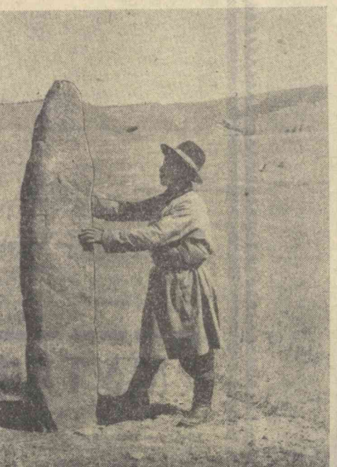
Монголия тупроғида мамлакатнинг қадимий маданияти тўғрисида гувоҳлик берадиган қўлгина ёдгорлиқлар сайланган...