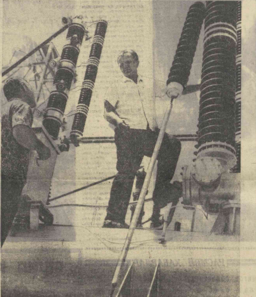
ТОШКЕНТ ОБЛАСТИ. Тошкент ГРЭСи Урта Оси ёдаги энг йирик тепловластанциялардан би-ридир. Унинг лойиҳада белгиланган кубвати салкам икки миллион киловаттга тенг.