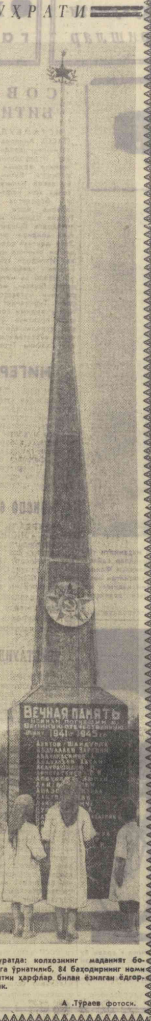
Суратда: колхознинг маданият боғига ўрнатиб, 84 боҳодирнинг номи харфлар билан эзилган ёлгорлик.

Ҳамқишлоқларни н инг номи-ни меҳр билан едга олган колхозчилар гадлаги вазибаларини ҳам муваф-фақиятди бақарадилар. М. НАЗАРОВ, «Совет Узбекистони» махсус мухбири.