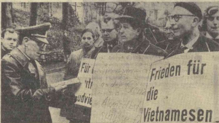
Гуздан Сайгонда бўлиб ўтган митингнинг қатнашчилари «Халқ вакилларидан тузилган ҳукуматнинг сотқинлик ҳаракатларини қоралаган» деб айтишди.

Париж, 13 январь (ТАСС). Гуздан олинган хабарларга қараганда, Вьетнамнинг қадимий пойтахти ва буддистлар қаранининг асосий маркази бўлган бу шаҳарда кеча нечкурини митинг бўлган. Бу митингга қатнашган 5 минг киши «Чан Ван Хонг ва унинг йўл остидagi ҳукуматнинг сотқинлик ҳаракатларини қоралаган. Митинг қатнашчилари қабул қилинган резолюцияда гаалаб қозонгунча нурашни давом эттиришга қатъий қарор берди, ҳукумат уртасидаги инсон бартараф қилиш йўлини топши мақсадида президент Фан Кхан Шиу билан музокаралар олиб бориш учун Гуздан Сайгонга иелангани маълум бўлиб қолди. Шу билан бирга, буддистларнинг раҳбар доиралари буддистларнинг расмий вакиллари ҳукумат раҳбарлари билан алоқа боғладилар, деган хабарларни рад этмоқдалар.