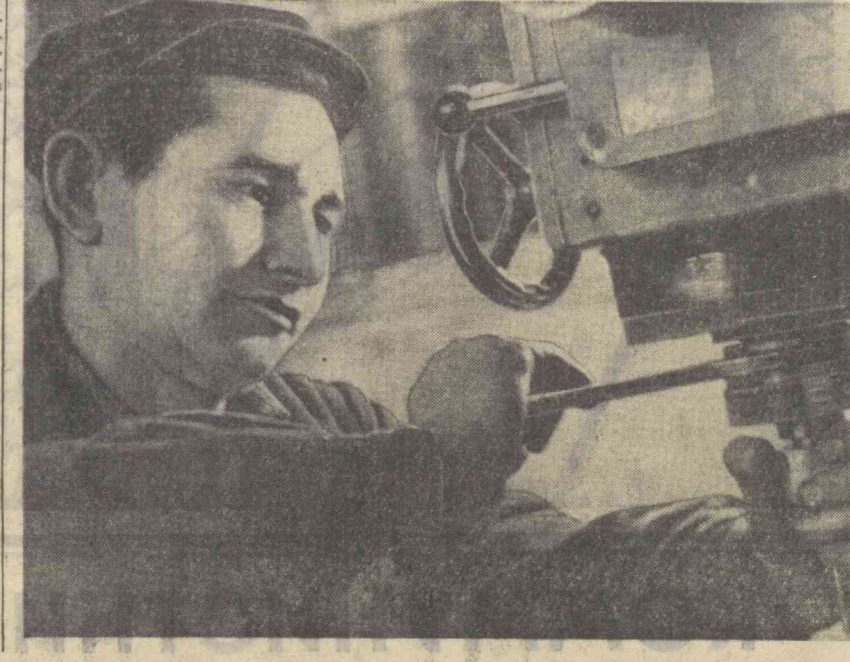
ЎЗБЕКИСТОН КП МК XII ПЛЕНУМИ ҚАРОРЛАРИНИНГ ИЖРОСИНИ ТЕКШИРАМИЗ