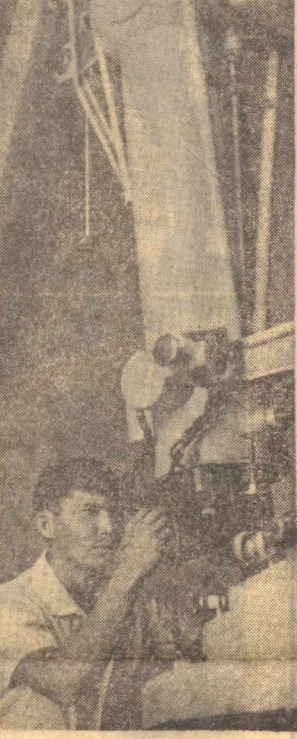
Қашқадарь области. Кинотехнический станцияси яхонада бешинчи ҳисобланади. Мазкур станция ҳодимлари бир неча йилдирки, энг муҳим мазсулар устида тадқиқот ишлари ўтказиб келишади...