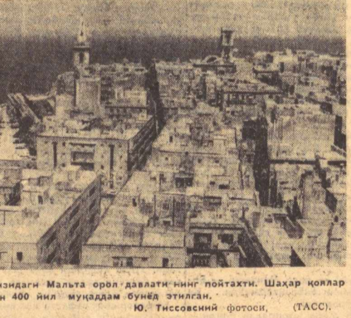
Ла-Валетта — Урта Ер денгизидagi Мальта орол давлати нинг пойтахти. Шаҳар қоплар устида тилланган бўлиб бундан 400 йил муқаддам сув элиган.