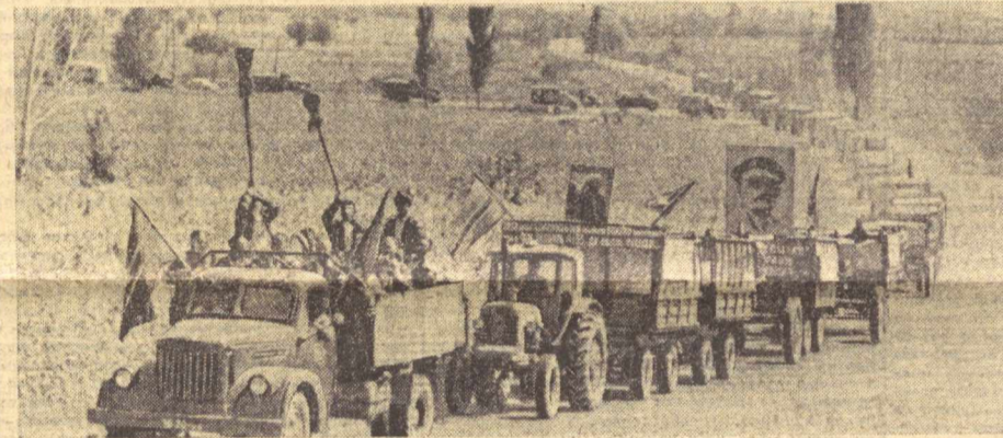
Республикамизнинг пахтакор хўжалиқларида «оқ олтин» йилгидек терим тобора авж олмақда. Деҳқон-нинг пешона тери билан етиштирилган дурдонани ортган қизил қарвонлар тайёрлов пунктлари томон йўл олмақда. Сурагларда: Бухоро об-ласт Рамитан ва Тошкент об-ласт Пискент районларида ташкил этилган қизил қарвонлар.