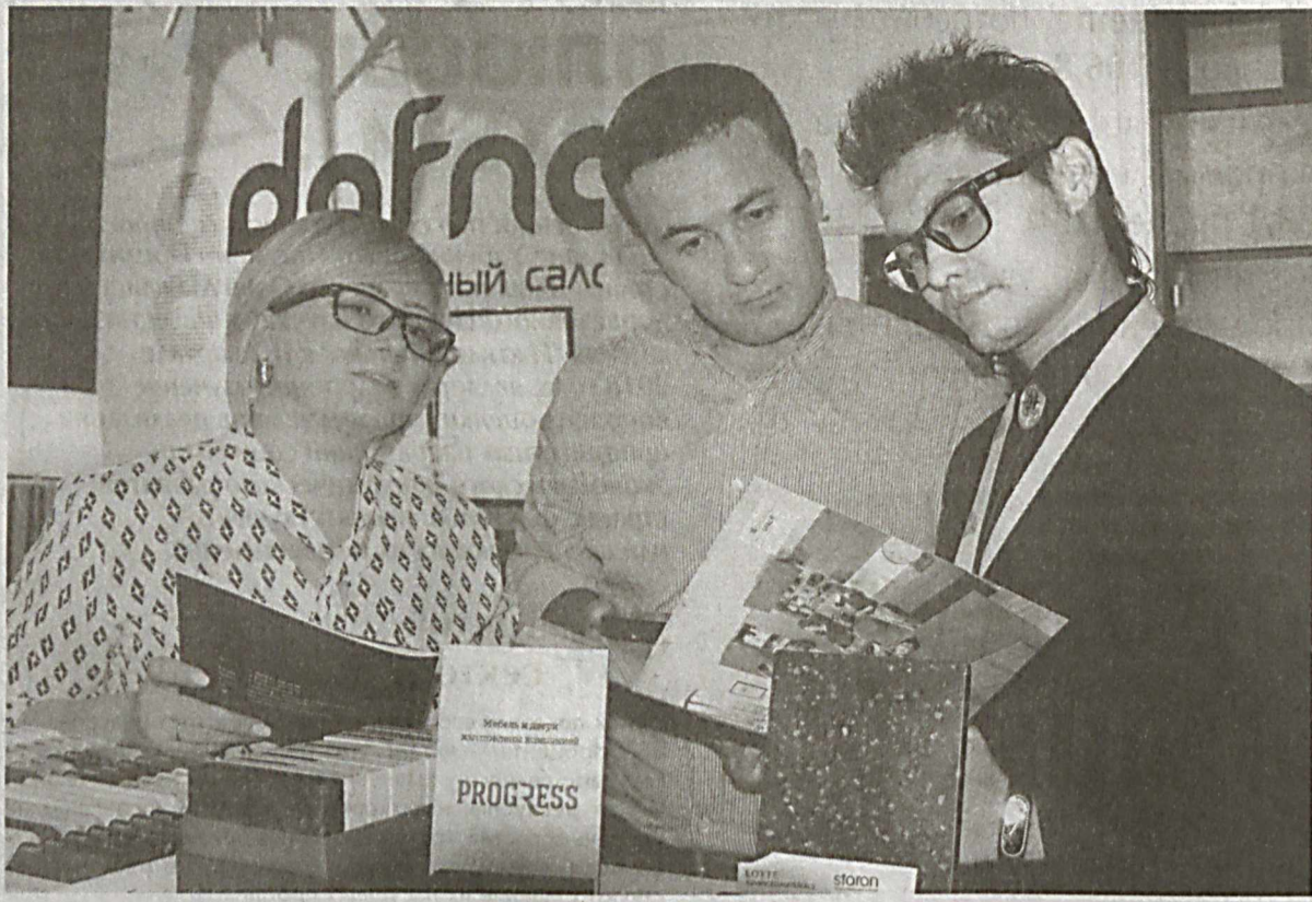
В эти дни в столице в отеле "Hyatt Regency Tashkent" проходит первая Неделя дизайна и архитектуры "UDAV-2018".