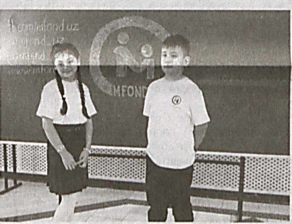
Краудфандинг - это первая в стране онлайн-платформа финансирования со стороны широкой публики, сообщила пресс-служба МНО.

Он создан Министерством народного образования Узбекистана, чтобы привлечь дополнительные средства для укрепления материально-технической базы школ, реализовать социально значимые проекты учеников и учителей, оказать поддержку детям с ограниченными возможностями и из малообеспеченных семей, а также стимулировать одаренных. Это первая в стране онлайн-платформа краудфандинга - финансирования со стороны широкой публики, сообщила пресс-служба МНО. Спонсоры могут быть благотворителями, родителями, бывшие выпускники, в том числе проживающие за рубежом. Среди вариантов для перечисления денег конкретной школе или в общий фонд - местные платежные системы "Payme", "Uray", "Click", международные "Visa", "Mastercard" и другие. Подобный инструмент поможет обеспечить прозрачность использования средств.