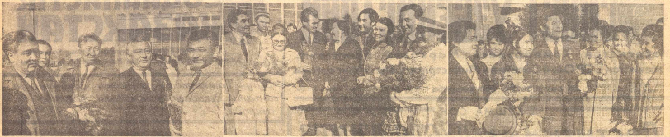
ХУШ КЕЛИБСИЗ, АЗИЗ УРТОҚЛАР! Қозоғистон адабиёти ва санъати декадаси қатнашчиларини Тошкентда кутиб олиш.