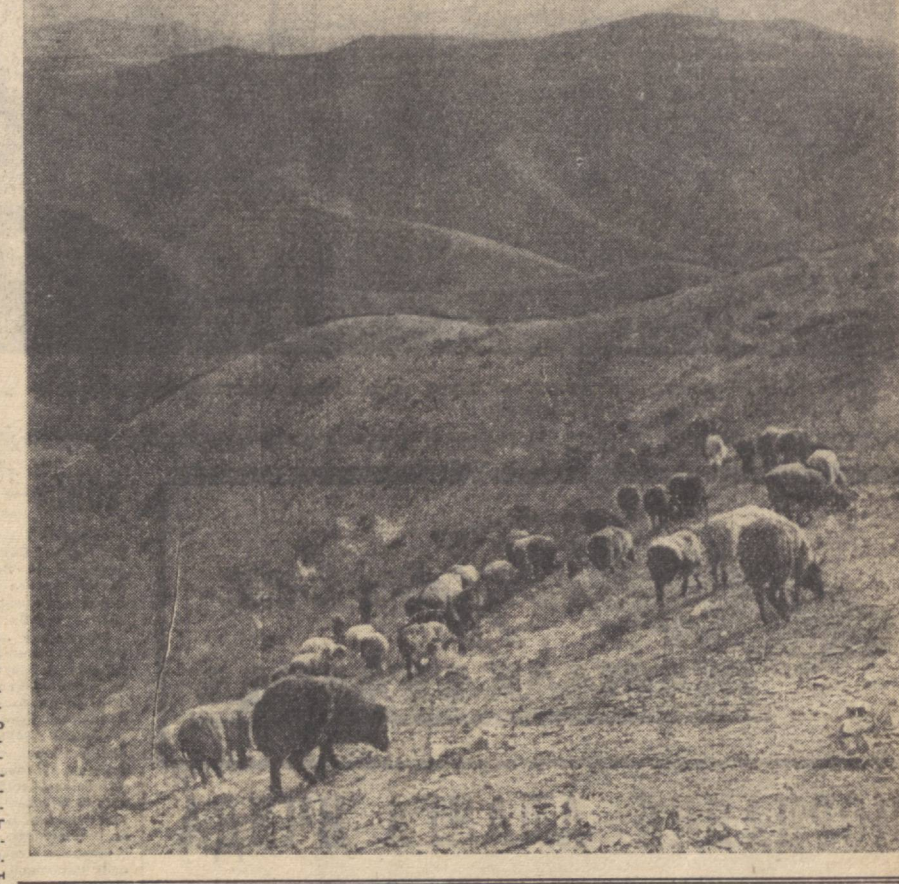
Республикамизда баҳор нафаси неъматда. Яйловлар ўтулган вақтда қорамоллар, чўчқалар ва паррандалар ҳаётда ҳам қизғин кунлар бошлаб кетди.

Мариэтта Сергеевна Шагиния Совет адабиёти асосчиларининг шонли адабига мансуб ёзувчи. У ўз ёганини дайд «1905 ва 1917 йиллардаги ишчи инқилобни қалбдан ҳис қилиб, умр-бо умри уларнинг олован билан ёнган» адибдир.