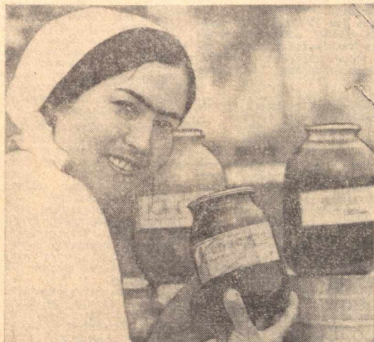
Фаргона консерва заводининг Ленинград райони маркази — Учкуйрик филиалда тайёрланган маҳсулотлар Иттифоқнинг Қамчатка, Узоқ Шарқ, Сибирь сингаги олис...