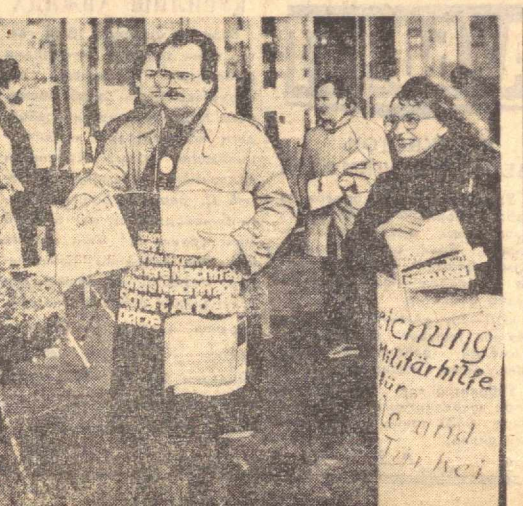
Фарбий Германиянинг коммунистлар кескинлигини юмшатиш ва халқлар ўртасида ҳамжиҳатлик учун, ГФР меҳнатчиларининг социал хуқуқлари ва демократик озодлиги учун қаттиқ ва мардондор кураш олиб бораётдилар.

Ҳосил ўрм-ингимда банд бўлган кишилар тўғрисида гамхўрлик кўрсатишмоқда. Улар бевосита даланинг ўзюда носоғ оғач билан таъминланмоқда.