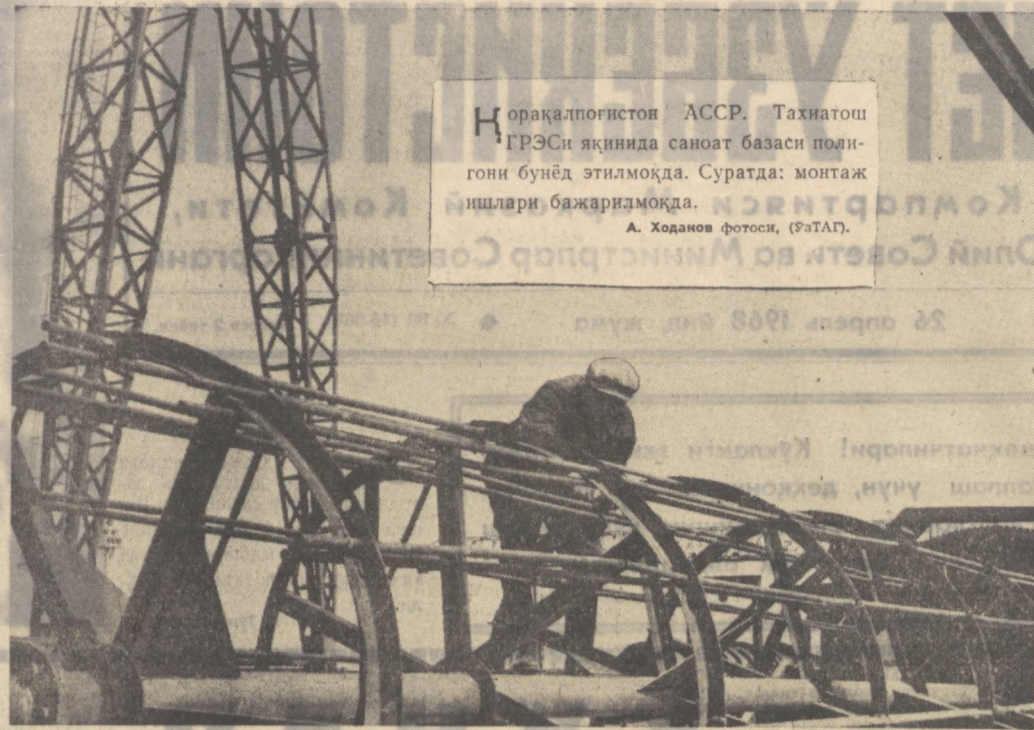
Қорақалпоғистон АССР. Тахياتош ГРЭСи яқинида саноат базаси полигони бунёд этилмоқда. Суратда: монтаж ишлари бажарилмоқда.