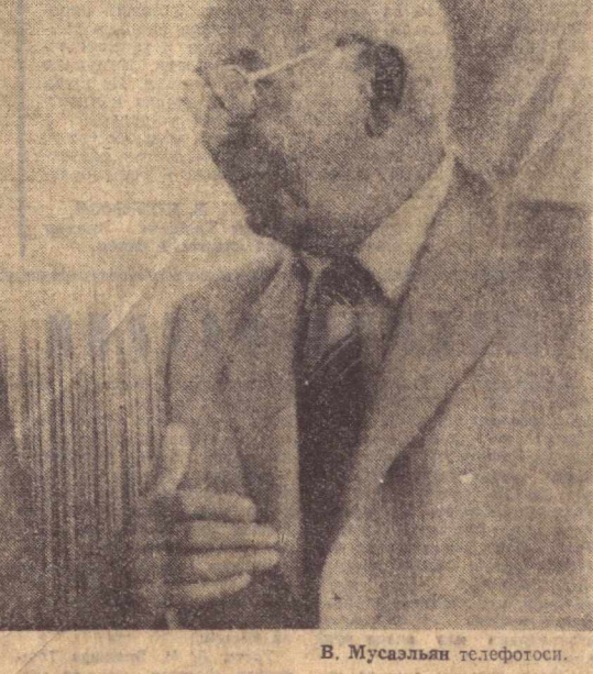
Суратда учрашув пайта.