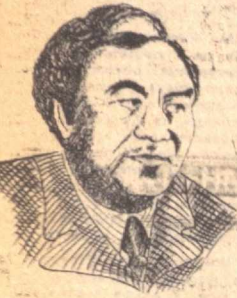
Давид Кугультинов ховирги замон Қолимиқ поэзиясининг пайдоқилувчилари бири. Расул Гаматов, Қасим Қўлиев, Ўтабай Нарим, Михаил Ду...

дин, Миртемир сингарм таниқил совет шондордан саяфидан мустақам ўрин олган хассос сўз саяфаткорларидандир.