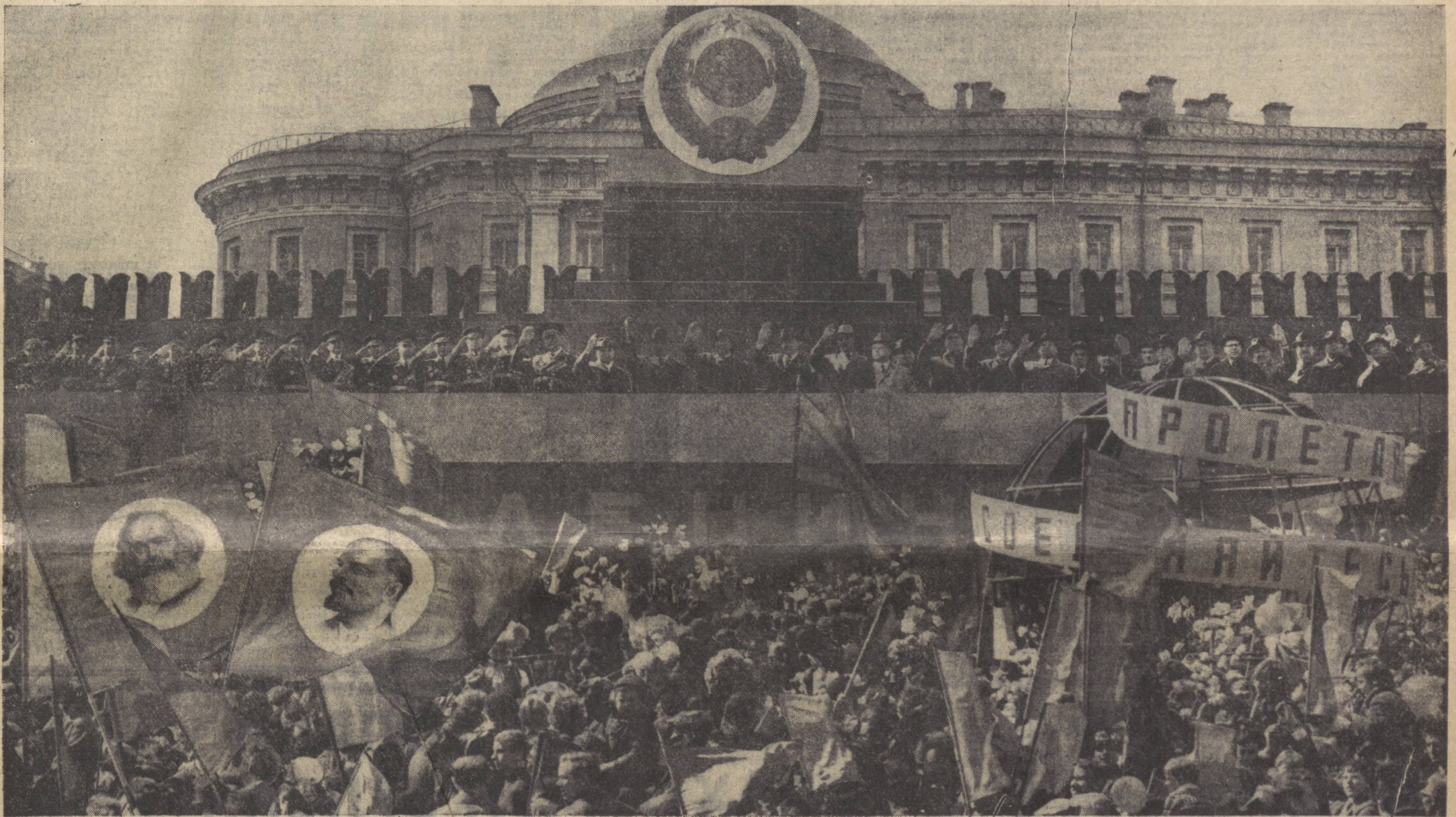
Москва, 1968 йил 1 Май. Суратда: Москва меҳнатнашлари вакилларининг намойиши.

Халқимиз Биринчи май байрамини тантанали ва хушнудлик билан нишонлади. Совет кишилари жонажон ленинчи партия теварагига мустақкам жипслашганликларини, пролетар интернационализмига содиқ эканликларини, коммунизм тантанасига комил ишончларини намойиш қилдилар.