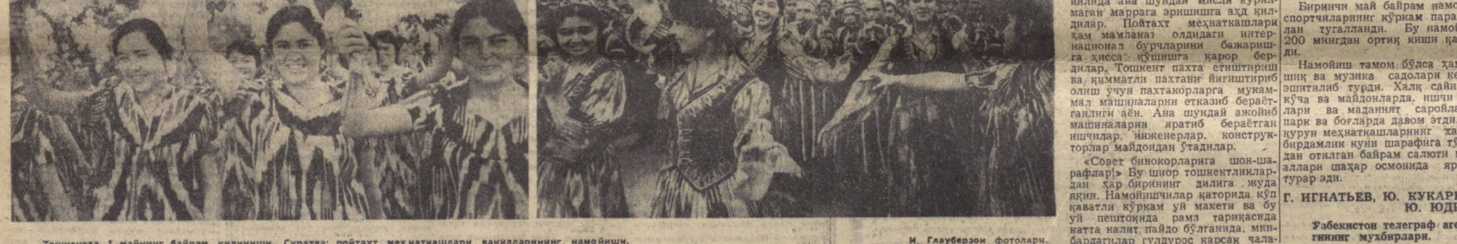
Тошкентда 1 майнинг байрам қилиниши. Суратда: пойтахт меҳнаткашлари вакиллариининг намоийши.