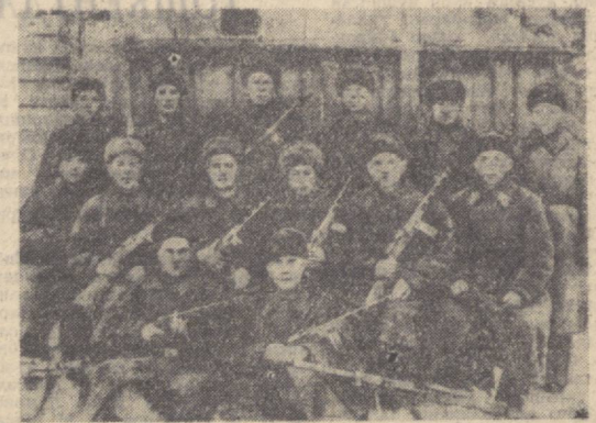
УШБУ йили сурат сизга узок йилларнинг воқеалари ҳақида хикоя қилади. Юқоридаги суратда 1941 йилда Нрюков мудофаасида иштирон этган панфиловчи-жангчилардан бир гуруппаси. Пастдаги суратда эса, бронеплошадани кўриб турибди. Унинг «Моманалдир» номи грандиранг уруши йилларида Туркистондаги Совет ҳўнмнати душманларига даҳшат солар эди.

Совет Армияси ва Ҳарбий-Денгиз Флотининг 50 йиллиги арафасида Туркистон Ҳарбий округи Кизил Байроқ ордени билан мунофотланди.