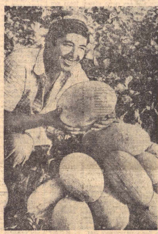
НАМАНГАН ОБЛАСТИ. Уйчи районидати «Гулнот» совхозининг полизларида мўл хосил етиштирилди...