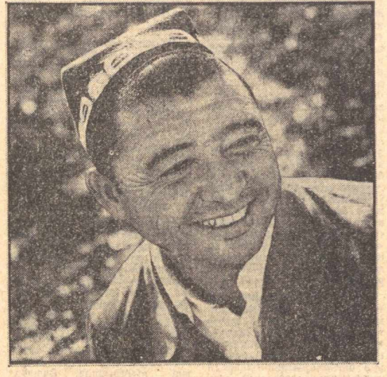
қаторда тилга олинади. Колхоз 1981 йил якунига кўра Бутиртинтфок социалистик мусобақаси голиби деб топилди, Қизил байроқ совриндори бўлди.

Колхозда пахта иши билан меҳнат қилаётган бундай ҳосил жоюқларни кўп. Шу туфайли хўжалик доимо илгорлар