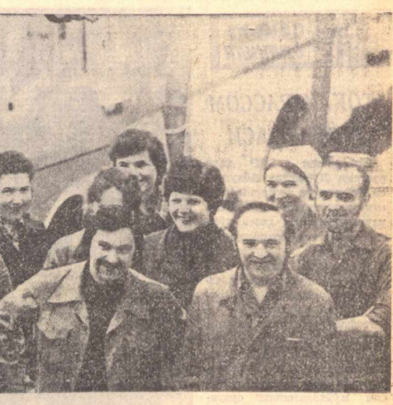
Латвия ССР ҳафталиги

ча этибор бермаётлар. Касб ўрганаётган йигит ва қизларнинг келгуси меҳнат фаолиятининг ўзинга хос хўсуятини ва уларнинг ёшлар жиҳосига олган ҳолда ижтимоий фанлар ўқитишни таъминлашнинг муҳим аҳамияти касб этмоқда. Талабалар ҳамда билим юртлари ҳодимларининг иқтисодий таълими юзасидан изчил иш олиб бориш ҳам давр тақозоси бўлиб қолди.