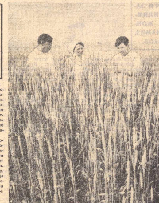
Мамлакат Озиқ-овқат программаси талабларини дилларига жо қилган серкўш улнамиз мелиораторлари Ноқоратупроқ заминида мўл-қул дон ҳосили этиштирдилар. Суратда: (юқорида) «Ўзбекистон» совхози даладарида пишиб этилган олтин бошоқли галлазор.

Қурувчилар қорхона пештақига «Биринчи советлар Ватанига — Ўзбекистондан» деган сўзлар ёзилган транспарантни ўрнаттиди. Мамлакатимиз тарихида Советлар илк бор ҳокимиятини ўз қўлига олган области — Иваново области экономикасини ривожлантиришга муносиб ҳисса қўлишга ҳаракат қилмаган Ўзбекистонлик барча вакилларнинг ҳис-туғилари мана шу сўзлар ифода этиди.