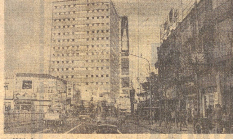
ЭРОН. Суратда: мамлакат пойтахти Техроннинг марказий кўчаларидан бири.

ЖАНУБИЙ ВЬЕТНАМ. Озодли армиясининг жаңгчилари Америна-Сайгон қўшинларига қаншақат зарба бермоқдалар. Суратда: Озодли армияси жаңгчилари Кунанчи аиллотида