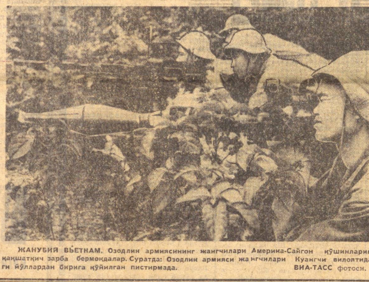
ЖАНУБИЙ ВЬЕТНАМ. Озодли армиясининг жаңгчилари Америна-Сайгон қўшинларига қаншақат зарба бермоқдалар. Суратда: Озодли армияси жаңгчилари Кунанчи аиллотида-ВИА-ТАСС фотоси.