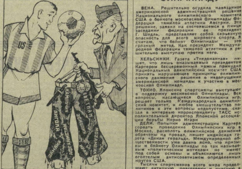
Поехать в Москву он мечтает с мячом, А ему на Восток предлагают с мячом.

Американская администрация заявила Национальному олимпийскому комитету США решение о бойкоте московской Олимпиады (из газет).