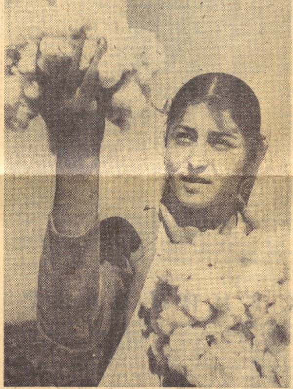
Республиканиннинг «оқ олтин» хирмони кундан-кунга юксалмоқда. Бунга Иштихон районидида «Янгинент» совхозининг пахтакорлари ҳам муносиб ҳисса қўшмоқдалар.