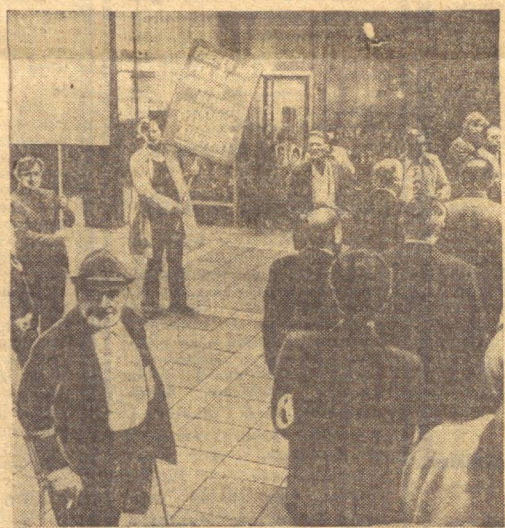
ГФР, Жамоатчилик тазйини остида Мюнхен пронураатураси намест харбий жиниятчи Клаус Барби иши жузисидан терговни янгиллашга қарор қилди. «Лмон жаллоди» деб ном қинқарган СС гаупштурмфюрери иккинчи жаҳон урушида мава шу француз шаҳрида гестапо бошлиғи бўлиб турган вақтда кўп вақийчилар қилган.

Суратда: Мюнхенга келган Француз Қаршилик ҳаракатининг қатнашчилари, Лион аҳли делегацияси жиниятчининг ҳаққоний жазолашни талаб қилмоқдалар.