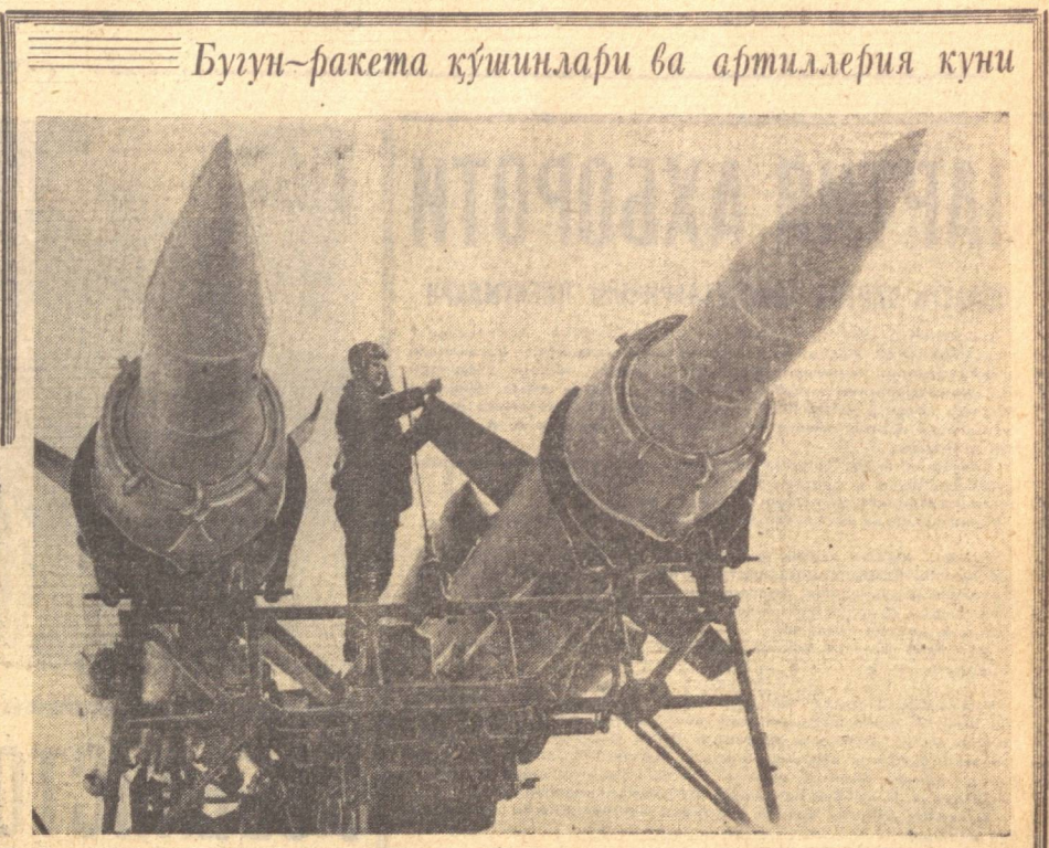
Бугун-ракета қўшинлари ва артиллерия кўни

Ўзбекистон Компартияси Марказий Комитети билан Ўзбекистон ССР Министрлар Совети ишонч билдириб айтидиларки, Тошкент шаҳрининг партия, совет, қасаба союз ва комсомол ташкилотлари метро қурувчиларга катта ёрдам берадилар ва метрополитен қурилишини муваффақиятли равишда амалга ошириш учун ҳамма қўл-ёғайларини биргаликда сарфлайдилар. Бу эса Ўзбекистон пойтахти Тошкент шаҳрини ободонлаштириш ва унинг меҳнатқашлари турмуш шароитини яхшилаш ишига қўшилган салмоқли ҳисса бўлади.