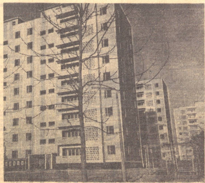
Суратда: республикамиз пойтахти Чилонзор массивидаги 11-кўрғонда қад кўтарган янги уй-жой бинолари. Ҳадемай бу уйларга меҳнатчилар кўчи киришади.