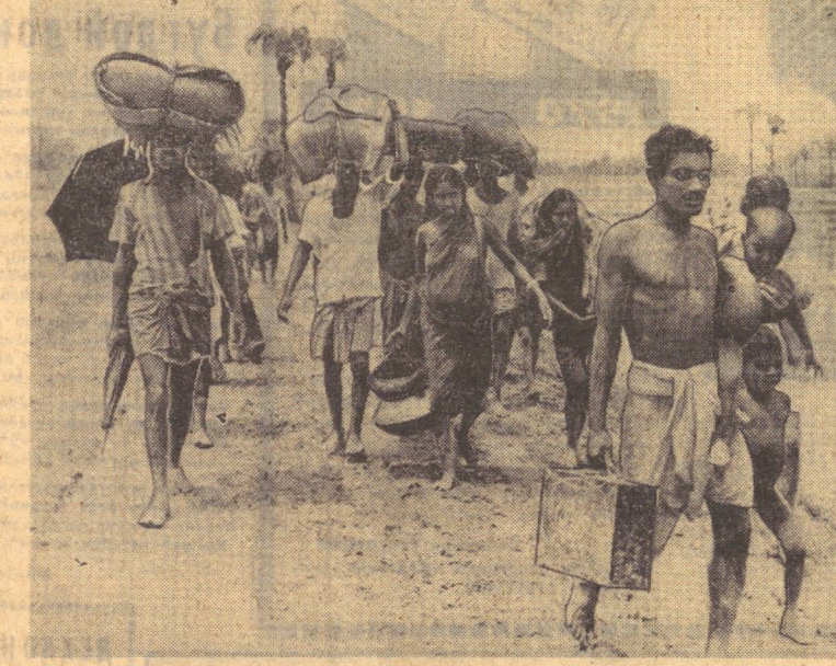
Шарқий Покистондан Хинд истонга оқиб келаятган қочоқларнинг кети узилмаётир. Сурада: Бошпана излаб юрган шарқий покистонликлар.