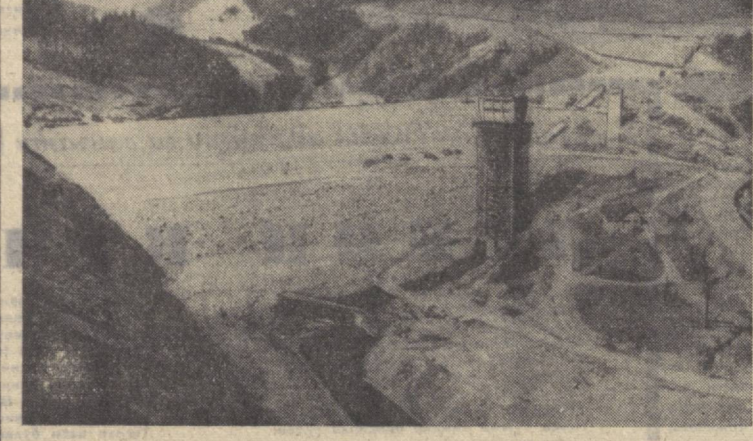
ЧЕХОСЛОВАКИЯ. ЧТК агентлигининг хабар беришига кўра, Остравица дарёси водийсида республикада энг катта тўғон бўлиб қолган. Бу янги ишхона тўғонни қўриб қолди. Остравица дарёси водийсида республикада энг катта тўғон бўлиб қолган.