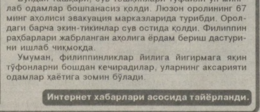
Интернет хабарлари асосида тайёрланди.

"Несат" тўфони 82 филиппинлик фуқаронинг, ордан беш кун ўтиб юз берган "Налгае" тўфони яна 19 кишининг ҳаётига зомин бўлди. Кўпчилик сув тошқинлари қурбони бўлишди. Қолганлари узилган электр симлари орқали ток уриб, шунингдек, кулаган бинолар остида қолиб, ҳалок бўлишди. 27 киши бедарак йўқолди. Шу боис ҳукумат қурбонлар сонни ортиб боришини кутаяпти. Бундан ташқари, сув тошқинлари туфайли ўн минглаб одамлар бошпанасиз қолди. Лозон оролининг 67 минг аҳолиси эвакуация марказларида турибди. Оролдаги барча экин-тикинлар сув остида қолди. Филиппин раҳбарлари жабрланган аҳолига ёрдам бериш дастурини ишлаб чиқмоқда. Умуман, Филиппинликлар йилига йигирмага яқин тўфонларни бошдан кечирадилар, уларнинг аксарияти одамлар ҳаётига зомин бўлади.