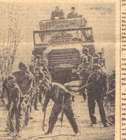
Ангола ватанпарварлари португалиялик мустамлакачиларга қишқич зарбалар берилганда давом этмоқдалар. Сурада: мустамлакачилар ватанпарварлар қўлиб кетган минларни излашмоқда.

ВАРШАВА. (ТАСС). Бу ерда Польша Бирлашган ишчи партияси Марказий Комитетининг иккинчи пленуми бўлиб ўтди. Пленум партия ташкилотларининг съезд олдидан мунозараларни ҳамда Польша Бирлашган ишчи партияси VI съездининг ҳужжатларидан келиб чиқадиган вазифаларига бағишланди. Марказий Комитет 1971 йилги