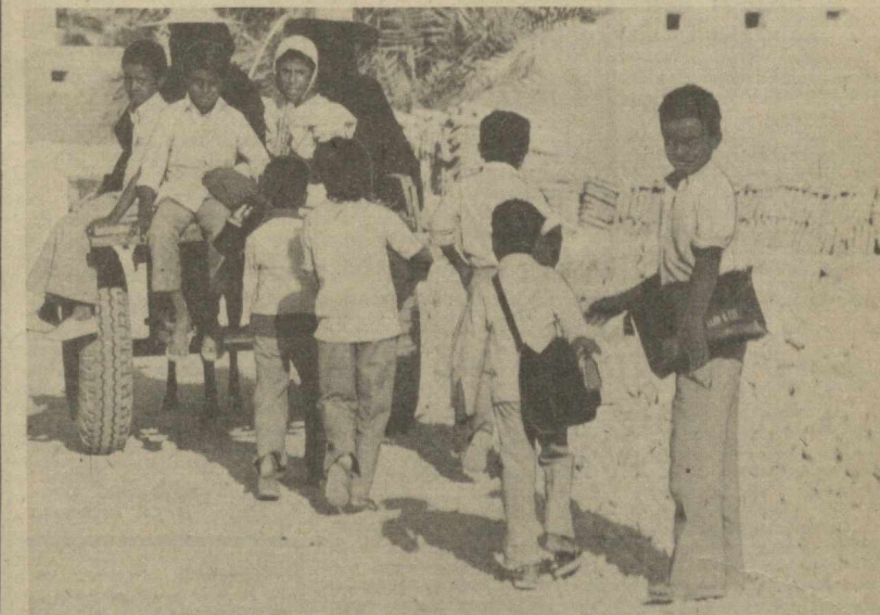
Яман Халқ Демократик Республикаси. Халқ ҳўжалигини янгилашда Демократик Яман қўёғасини тўбдан ўзгарди. Халқ ҳўжалигининг етакчи тармоқлари раванкига Совет Итти-

Совет парламенти барча халқларга, барча ҳолис ниятлик кишиларга мурожаат этиб, жаҳон ёғини чиқилиш мумкин бўлган уқунини вақт фаниматига ўчиришга чақирди. СССР Олий Совети, деб таъкидлайди Парижда чиқадиган «Юманте» газетаси, Совет Иттифоқи хоғ Шарқдаги биронта мамлакатнинг хавфи сизилганига кўз олайтираётгани йўқлигини тантанали равишда билдирди. Совет