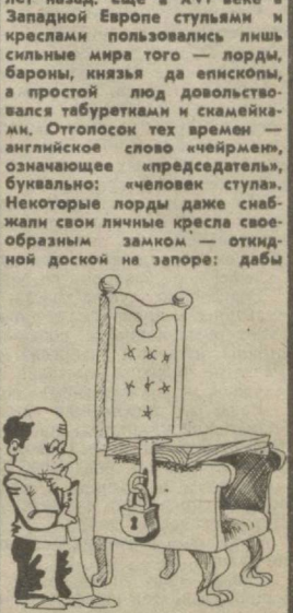
нико из черни не мог оксвернуть аельмоужую мебель в отсутствие хозяина. Если уж в кресло усаживались, то со вкусом, надолго. А в замках гуляли сквозняки, было холодно и простудно, поэтому сановники отправлялись на восседание, как на прогулку, — одевались потеплее. Кресла не делались закрытыми с трех сторон — послыная профилактика насморка и простела. Когда пришла мода и юбки с фижмами и кринолинами, то изменился и облик стульев: они стали низкими и широкими. Фрак произвел подлинный переворот в мире стульев: дабы не помять фалды, дважельмены сядились задом вперед.

Отговсюду обо всем КОЕ-ЧТО О СТУЛЬЯХ Примерно две трети населения земного шара не пользуются в повседневной жизни стульями — обитатели стран Азии предпочитают сидеть «по-турецки», в Африке и Южной Америке жители сельских местностей любят отдыхать на корточках. Представители оставшейся трети человечества — приверженцы стульев — в большинстве своем не подозревают, что этот незамысловатый предмет обстановки [в том виде, в котором мы его знаем, со спинкой и ободом не более 400 лет назад. Еще в XVI веке в Западной Европе стульями и креслами пользовались лишь сильные мира того — лорды, бароны, князья да епископы, а простой люд довольствовался табуретками и скамейками.