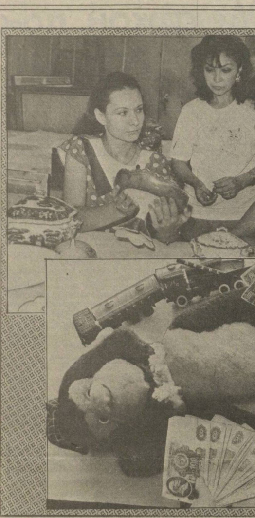
ТАШКЕНТ. Коллеги Узбекской республиканской таможенной Главного управления государственного контроля при Совете Министров СССР с расширенным внешнеэкономическими связями...

И национальное, и интернациональное У ЧИСТЫХ ВОД Вот почему не называю адреса и фамилий. Живут они счастливо. Семья получилась большой, дружной, трудолюбивой. Собственно, уже несколько семей: старшие давно выросли, имеют своих детей.