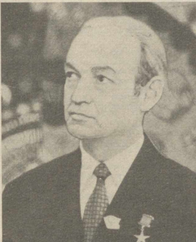
«ОЧИҚ ЭШИК» СИЁСАТИ

Узбекистон ССР ва Ўзбекистон Компартияси ташкил этилганлигининг 60 йиллигини муносиб кутиб олиш учун мусобақа қўйилган корхона коллективни йил охирига 1,5 минг тонна шертли ёқилги ва қўлаб электр энергияни тежамга қарор қилди. Новадорлар ана шу ишларни бажаришда фаол қатнашмоқдалар.