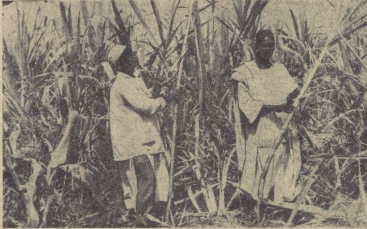
ЧАД РЕСПУБЛИКАСИ. Шакарқамшини ўриш пайти.

Мальгаш Республикаси Мадагаскар оролида жойлашган бўлиб, мамлакат аҳолисининг асосий қисмини саналава қабиласига мансуб иккилар ташкил этади. Сиз юқоридаги суратда саналава қабиласига мансуб иккиларнинг турмуш йўллариини кўриб турибсиз. Пастдаги суратда эса Нуси-Бет тоғи этанларига усадиган равенала — «сайёҳ даряхти» тасвирланган. Бу пальма даряхти гигант өлгинчи эслатади. Узунлиги 4 метр иеладиган барглари орасида эса сайёҳларнинг қанқонини босадиган муздақчи шафбатни доимо топиш мумкин. Саналава қабиласи бу пальманинг фанат шарбатидангина эмас, балки ундан нурилийш материали сифатида ҳам фойдаланади.